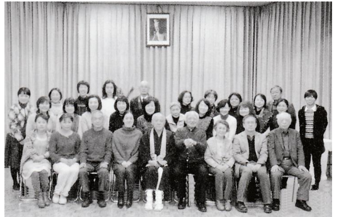
△ 修正会参加の皆さん

主管の講話は「道」のお話。昨年末に訪れたインドのこともお話しされました。法話のあと、記念撮影。その後、甘酒で歓談し新年の思いを語り合いました。今年も日本ヨーガ学会の方がたくさん参加されました。