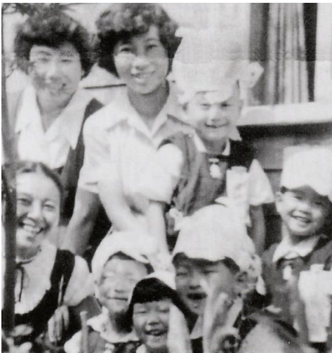
△神田寺時代の先生（中央）

※「子どもの文化」阿部先生追悼特集号ご希望の方はお申出下さい。（送料とも400円 後払可）