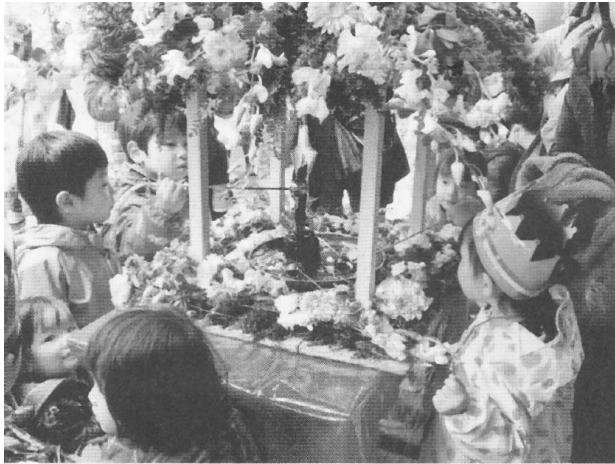
△ 花御堂のお釈迦様に甘茶がけ

また、小学校の入学式日程と重なり小学生の参加はわずかでしたが、たくさんの園児や保護者の方々において頂き、甘茶がけなど盛大に行なうことができました。