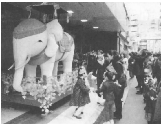
△ 神田寺正面に飾られた白象